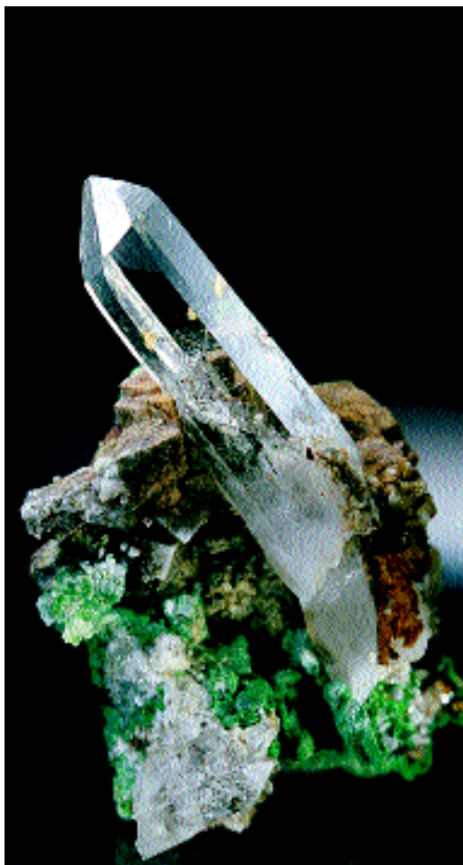
Der Glanz der Natur: Quarz auf Malachit und Siderit aus Cavradi. Sammlung M. Giger, Disentis

nen Kristall einfach abbrechen, nur um «wenigstens etwas» davon mitnehmen zu können. Lieber nimmt er stundenlange Arbeit auf sich, den Fels in handliche Stücke zu zerlegen, um die ausgewachsenen kristallisierten Mineralien möglichst schadlos zu bergen. Nun erreicht die Spannung ihren ersten Höhepunkt, denn noch kann der Strahler nicht genau abschätzen, welchen Umfang und Wert er in seinen Händen hält. Mit der nächst greifbaren Flüssigkeit, sei dies Eistee aus der Feldflasche oder Mineralwasser, wird ein besonders ins Auge stechendes Stück, als Test, mit vor Aufregung zitternden Händen, hastig vom Lehm und Schmutz befreit.