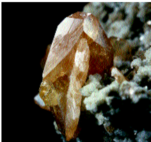
Titanit vom Lukmanier aus der Sammlung G. Venzin-Marty, Disentis

Schwingung gerät. Eine erfreuliche Entdeckung, denn ein solcher Schwingquarz konnte nun zur Kontrolle von Radiowellen und zur Regulierung in Quarzuhren verwendet werden. Quarzsand dient auch als wichtiger Rohstoff für die Glas- und Keramikindustrie. Durch die steigende Nachfrage der modernen Technologien nach reinen untadeligen Quarz- und anderen Kristallen, liegt es nahe, dass sich Wissenschaftler seit vielen Jahren darum bemühen, solch makellose Kristalle künstlich herzustellen, um somit ihre Grösse und Gestalt beliebig wählen zu können. Denn das aus Quarz mit Kohle gewonnene Silizium wird für die Elektronik verwendet, die inzwischen zu einer richtigen Kristalltechnologie geworden ist. Was wäre unsere Gesellschaft zum Beispiel ohne Notebooks, Kreditkarten oder Ferienphotos? In fast jedem elektronischen oder optischen Gerät, das wir benutzen, findet man künstlich gezüchtete Kristalle. Von ihrer Perfektion hängt also u. a. die weitere Entwicklung und Verbesserung der Elektronik ab. Die Kristalle haben die Menschen über sich viele Jahrtausende im Dunkeln gelassen, wäre es da nicht möglich, dass die anscheinend so durchsichtigen Prachtgebilde der Natur noch weitere Geheimnisse verbergen, die vielleicht, wie alle gut verborgenen Geheimnisse, direkt vor unserer Nase liegen und uns zuglitzern? •KC