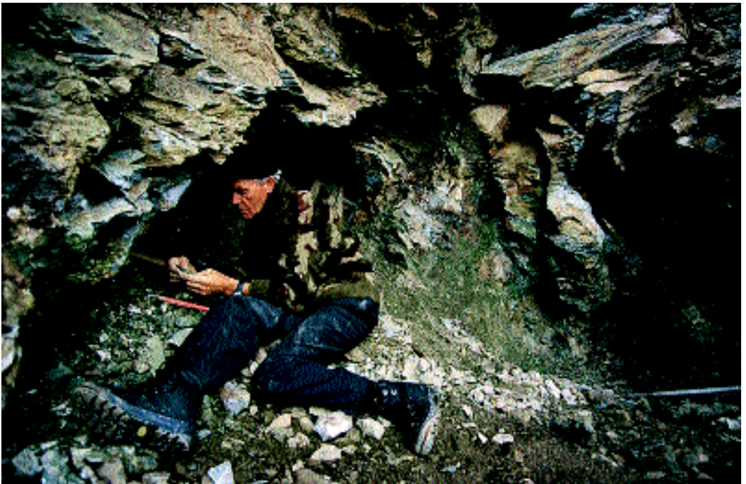
Ein Strahler inspiziert die Schätze einer soeben geöffneten Klufft.

Ihren zweiten Höhepunkt erreicht die Spannung schliesslich zu Hause, wo der Strahler nach gründlicher Reinigung, Umfang und Wert seiner Ausbeute genau abschätzen kann. Die gewonnenen Kristalle werden an Sammler und Touristen verkauft. Sammler und Kenner besuchen die jährlich im Herbst und Winter in der Schweiz stattfindenden Mineralbörsen, auf denen viele schöne Stücke angeboten werden. Auch Museen und die Wissenschaft sind interessierte Abnehmer. Je nach Art und Qualität des Kristalls kann er mehrere tausend Franken wert sein, die anspruchsvolle Suche kann sich also wirklich bezahlt machen. Obwohl manch glücklicher Strahler kiloweise Kristalle ins Tal schleppt, wird es auch in Zukunft noch vielen passionierten Sammler gelingen, schöne Funde zu tätigen. Wenn auch in unserer Zeit keine neuen Bergkristalle in den Alpen mehr entstehen, weil weder Druck noch Temperatur in notwendiger Höhe vorhanden sind, sorgen doch Verwitterung und Erosion dafür, dass noch einige Schätze, die