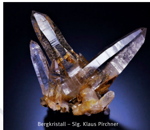
Bergkristall – Slg. Klaus Pirchner

ore 10.00 Inaugurazione della 21° Info Minerali ore 14.00 Presentazione di Erwin Burgsteiner Titolo: “I cacciatori di cristalli in Val di Rauris”.