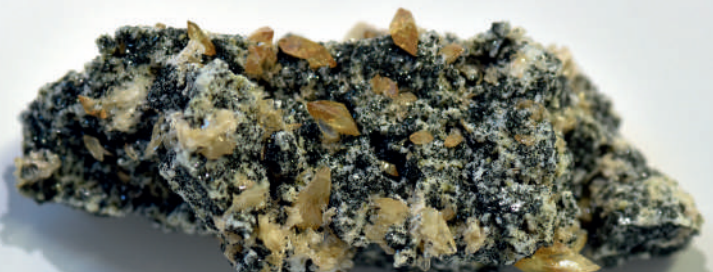
„Titanit“ – Finder Enz Oswald